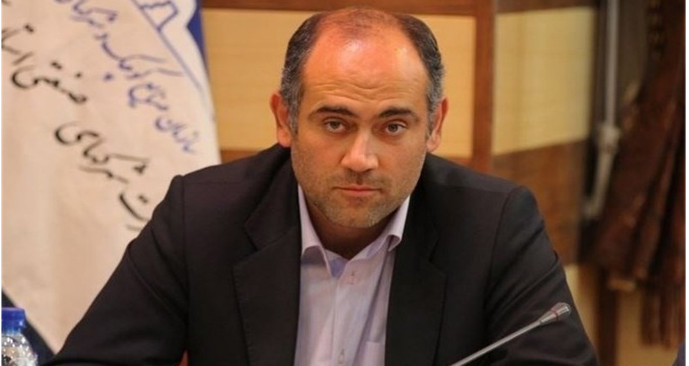
مدیرعامل شرکت شهرکهای صنعتی آذربایجان شرقی: